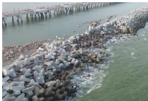
图2 “山竹”台风后堤身受损情况

2018年9月,受超强台风“山竹”的影响,防波堤南段K1800附近100 m范围内再次受损,受损情况见图2。鉴于近年来我国南部海域出现的台风频率与强度均有所增加,某高校对项目所在海域再次进行波浪整体数学模型研究,结果显示工程推算的设计波要素发生了较大的变化,50 a一遇外海波高比2009年的波浪数学模型研究(包含1949—2008年台风)波高增大约14%。若继续沿用原设计结构断面对防波堤进行修复,其防护能力与可靠性已无法满足掩护需求。为保障港内码头生产作业的安全,需详细分析其损坏的主要原因,结合工程实际情况,在兼顾施工可行性、经济性等因素的基础上,制定更为适宜的加固方案。