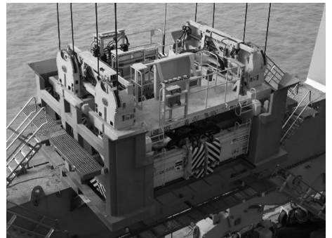
图4 RAM Singflex 双吊具可分离上架

RAM 公司最新研发的 Singflex 双 40 ft 双吊具可分离上架(图4)能够从容满足双吊具的前后分离、上下错位、水平平移等实际操作工况,其采用双独立的上架结构形式,解决了与其它吊具厂商吊具的通用性问题(不兼容 Stinis 吊具的单销轴连接形式)。由于采用平移分离形式,其结构较为轻巧和紧凑,高度仅为 3 m,双吊具模式时上架质量为 12.7 t,单箱模式时上架质量为 9.8 t,这对桥吊起升高度和负荷设计带来益处。RAM Singflex 双吊具可分离上架的单/双吊具模式转换采用安装在桥吊海侧下横梁上的专用转化平台完成,整个转化过程在 90 s 内完成,完全不需要人工干预。