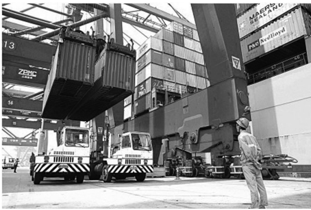
图1 双起升桥吊形式

(图1),其作业效率理论上可提升50%~60% [3] ,它的诞生引起世界港口的普遍关注。2006—2010年,阿联酋迪拜、新加坡、韩国釜山、德国汉堡、马来西亚PTP、深圳盐田港、上海洋山港等使用数量达到277台 [4] ,其中洋山深水港区二、三期码头所配置的42台集装箱桥吊中就有29台此类型双起升桥吊,如此大规模的双起升桥吊的批量集中使用,在国内、外港口码头中还属首创,这对提高码头整体装卸效率和装卸工艺的改革起到决定性的作用,也使洋山深水港区的集装箱装卸工艺处于世界一流水平。