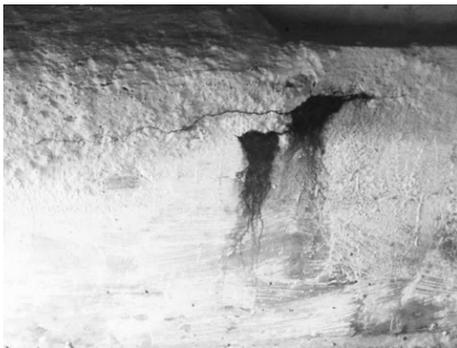
图4 横梁侧面顺筋裂缝