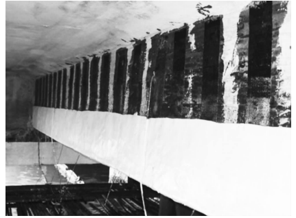
图7 工作平台纵梁碳纤维加固和防腐