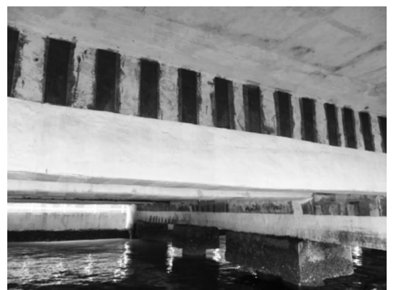
图10 工作平台外观良好