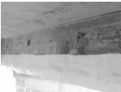
图6 人行桥纵梁防腐