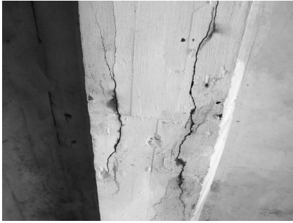
图3 纵梁底部顺筋裂缝