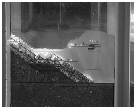
图 2 断面 1 模型

由表 2 可以看出, 工况 1-1 ~ 1-6 之前各组即波高 H_{13\%} < 0.179 m 时, 32 g 扭王字护面块体都是稳定的; 当 H_{13\%} 增大到 0.189 m 时, 护面块体出现了失稳现象。