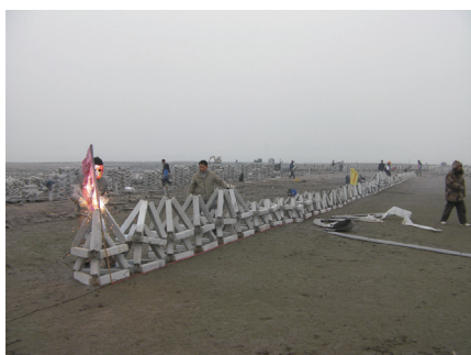
图4 焊接拼装透水框架

四面六边透水框架成品从预制场到滩面施工区再进行人工摆放,中间转运次数多,运输船装载框架数量也有限,空间利用率小。为减少损耗、提高效率,透水框架杆件预制完成后,直接将透水框架杆件装载上运输船,运抵现场码头后,通过运输车分别运送到每个施工区附近,现场进行焊接拼装,最后人工进行摆放。如图4,5所示。