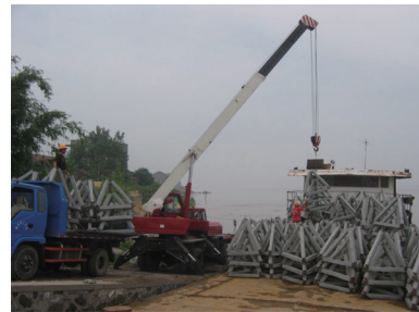
图2 吊车装框架上船

透水框架杆件在预制场预制好后, 集中进行框架拼装焊接, 存放于预制场成品堆场。装船运输时, 采用经过简单改装后的装载机, 将框架吊装在运输车上, 运输车运到装船码头后再由汽车式起重机吊装到运输驳船上, 见图2。为增加船舶的运输量, 提高经济效率, 宜将框架重叠在一起运输, 运输船两边须留有空挡, 提供人工抛投的作业区域, 最后由运输船运往施工现场。待定位船准确确定好位后, 框架运输船停靠定位船, 由人工实施抛投, 见图3。