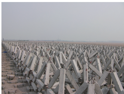
图5 滩面摆放的透水框架