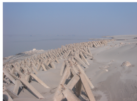
图8 护滩带边缘淤埋的透水框架

周天河段位于长江中游上荆江末端,上起湖北江陵郝穴,下迄古长堤,全长28 km,是长江中游重点浅滩河段之一。为巩固目前较为有利滩形,控制进口主流,维持周公堤水道上过渡、天星洲水道左槽一次过渡的形式,并为后续工程奠定基础,2006年实施了长江中游周天河段航道整治控导工程。