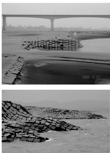
图1 护滩带水毁实例

上，其受损毁的程度较轻或基本上不受损坏；当护滩带修建在江心孤立的洲滩上，且洲滩受水流迎流顶冲作用较强，则护滩带的损坏十分严重；对护滩带边缘进行适当处理后，护滩效果较好，其受损毁的程度较轻。