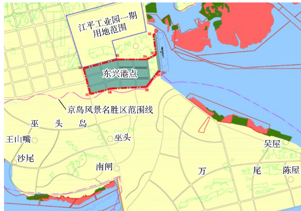
图4 东兴港点规划平面布置初步方案

规划东兴港点主要服务面向东盟及 RCEP(区域全面经济伙伴关系协定)十五国的水产品、中草药材、农副土特产品、进出口加工品等商品互市贸易海运需求, 规划为通用及多用途码头区。综合考虑东兴市建港条件, 初步考虑可规划布置 8 个 5 000 吨级及以下通用及多用途泊位, 形成码头长度约 1.1 km, 年通过能力 400 万 t。港址开发前, 需开展系统、深入的前期研究论证工作, 调整优化码头、航道等级和布置方案, 见图 4。