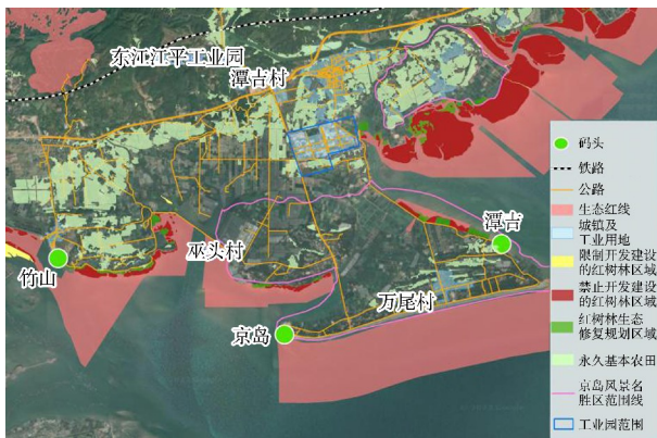
图3 东兴港点现状码头及周边生态敏感因素分布

东兴市目前主要已建有京岛港、竹山港和谭吉港等小型港口, 吞吐量主要以服务边境贸易和地方经济发展的物资运输为主, 吞吐量近年增长较快, 2018 年完成 584 万 t。其中, 京岛港现有 1 000 吨级泊位 1 个, 设计综合能力 10 万 t 和 30 万人次, 主要以边贸货物运输和旅游为主; 竹山港现有泊位 18 个, 设计综合通过能力 98 万 t。主要接卸越南煤, 船舶利用原有河道乘潮进出港; 谭吉港现有码头泊位 7 个, 主要以越南煤和杂货运输为主, 船舶需乘潮进出港。见图 3。