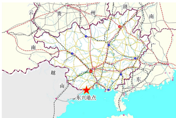
图2 东兴市东兴港点地理位置及东兴市综合交通规划

西至东兴市区 23 km, 东至防城港 55 km, 海上至越南下龙湾 70 n mile, 与越南北方重要城市海防距离 110 n mile, 与北海港距离 52 n mile, 与海南的海口港距离 130 n mile, 见图 2。